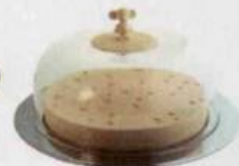
Cloche à fromage MG30 d'Alessi, 195 €, store.alessi.com.