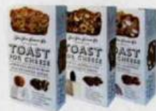
Toasts The Fine Cheese Co. Existent en 3 saveurs: pour fromage bieu, de chèvre ou crémeux. 4,45 € la boîte de 100 g, chez Delhaize.